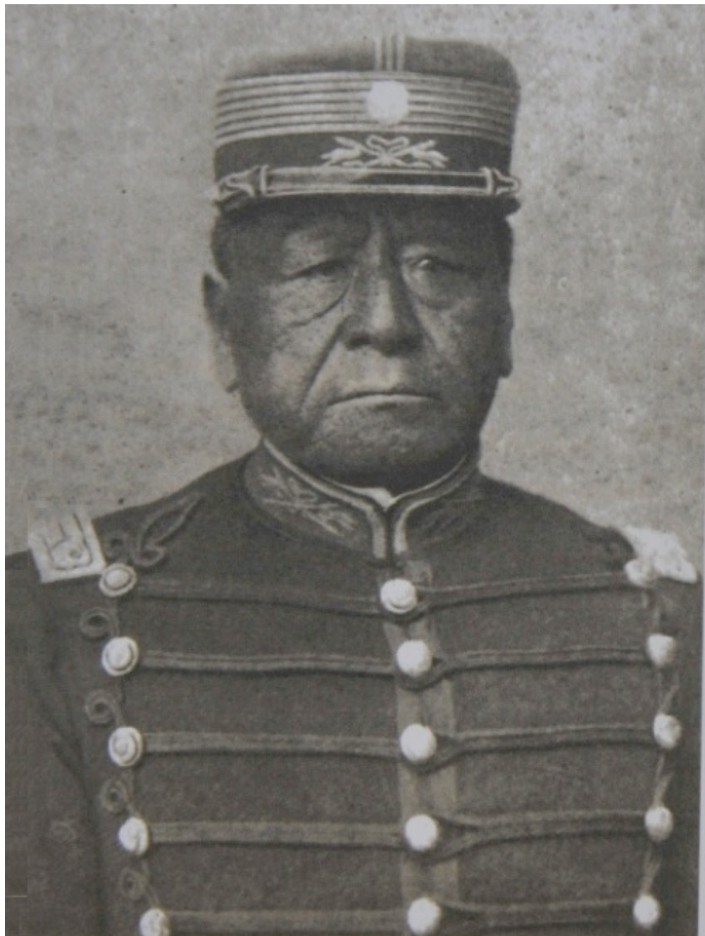
Manuel Namuncurá circa 1900