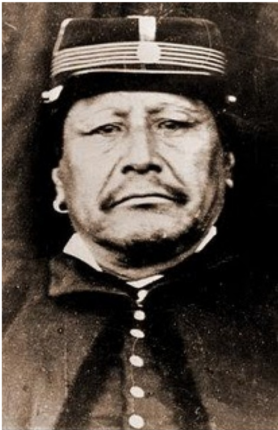
Calfucurá (Piedra Azul en castellano)