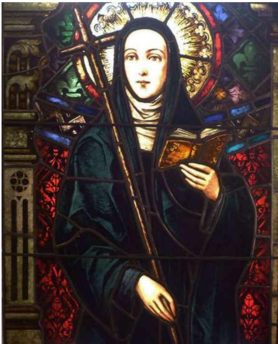
Vitreux de la Beata en una Iglesia de Buenos Aires